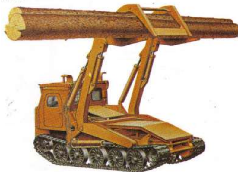
Рис. 29 Лесопогрузчик ПЛ-2.

Рабочее оборудование шарнирно крепится на раме базового трактора, и состоит из П-образной стрелы и челюстей, нижних – подвижных, верхних – жестко закрепленных. Привод рабочего оборудования от гидроцилиндров.